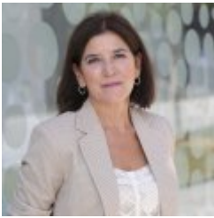
Izaskun Bilbao Barandika

Desde 2009-: Diputada al Parlamento Europeo Licenciada en Derecho (UPV) Máster en Gestión de Empresas - UPV Carrera política 1987-1991: Concejala del Ayuntamiento de Bermeo, áreas de Urbanismo y Cultura 1998-2001: VI Legislatura - Presidenta de la Comisión de Agricultura y Pesca; vocal de la Comisión de Instituciones e Interior, de la Comisión de Economía y Presupuestos y de la Comisión de Mujer y Juventud. 2001-2005: VII Legislatura - Parlamentaria en el Parlamento Vasco; presidenta de la Comisión de Agricultura y Pesca; vocal de la Comisión de Instituciones e Interior, de la Comisión de Industria, Comercio y Turismo, de la Comisión de Mujer y Juventud y de la Comisión de Control de Gastos Reservados. 2005-2009: VIII Legislatura - Presidenta del Parlamento Vasco. 04/2009-07/2009: Parlamentaria en el Parlamento Vasco. 1989-1994: Directora de Servicios del Departamento de Cultura del Gobierno Vasco. 1996-1998: Direcde Servicios del Departamento de Interior de