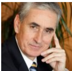
Ramón Jáuregi Atondo

Ramón Jáuregui Atondo ha ejercido variadas e importantes responsabilidades en el campo de la política regional, estatal y europea. A nivel regional, ha sido Vicelehendakari del Gobierno Vasco, así como Consejero de Justicia, Economía, Trabajo y Seguridad Social. En el ámbito estatal, fue Diputado en el Congreso de los Diputados, así como Ministro de Presidencia del Gobierno de España. En lo referente al campo de la política europea, ha sido miembro del Parlamento Europeo en dos ocasiones (de 2009 a 2010 y de 2014 a 2019). Es Ingeniero Técnico por la Escuela de Peritos de San Sebastián y Licenciado en Derecho por la Universidad del País Vasco. Ha ejercido como abogado en materia de Derecho laboral. Es autor de varios libros y numerosos artículos sobre el Estado autonómico, nacionalismo, las relaciones laborales y justicia social, entre otros.