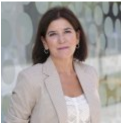
Izaskun Bilbao Barandika

Desde 2009-: Diputada al Parlamento Europeo Licenciada en Derecho (UPV) Máster en Gestión de Empresas - UPV Carrera política 1987-1991: Concejala del Ayuntamiento de Bermeo, áreas de Urbanismo y Cultura 1998-2001: VI Legislatura - Presidenta de la Comisión de Agricultura y Pesca; vocal de la Comisión de Instituciones e Interior, de la Comisión de Economía y Presupuestos y de la Comisión de Mujer y Juventud. 2001-2005: VII Legislatura - Parlamentaria en el Parlamento Vasco; presidenta de la Comisión de Agricultura y Pesca; vocal de la Comisión de Instituciones e Interior, de la Comisión de Industria, Comercio y Turismo, de la Comisión de Mujer y Juventud y de la Comisión de Control de Gastos Reservados. 2005-2009: VIII Legislatura - Presidenta del Parlamento Vasco. 04/2009-07/2009: Parlamentaria en el Parlamento Vasco. 1989-1994: Directora de Servicios del Departamento de Cultura del Gobierno Vasco. 1996-1998: Direcde Servicios del Departamento de Interior de