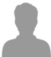
Andoni Ortuzar Arruabarrena

Ramón Jáuregui Atondo ha ejercido variadas e importantes responsabilidades en el campo de la política regional, estatal y europea. A nivel regional, ha sido Vicelehendakari del Gobierno Vasco, así como Consejero de Justicia, Economía, Trabajo y Seguridad Social. En el ámbito estatal, fue Diputado en el Congreso de los Diputados, así como Ministro de Presidencia del Gobierno de España. En lo referente al campo de la política europea, ha sido miembro del Parlamento Europeo en dos ocasiones (de 2009 a 2010 y de 2014 a 2019). Es Ingeniero Técnico por la Escuela de Peritos de San Sebastián y Licenciado en Derecho por la Universidad del País Vasco. Ha ejercido como abogado en materia de Derecho laboral. Es autor de varios libros y numerosos artículos sobre el Estado autonómico, nacionalismo, las relaciones laborales y justicia social, entre otros.