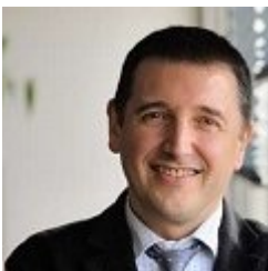
Fernando Fantova Azcoaga

Desde 2009-: Diputada al Parlamento Europeo Licenciada en Derecho (UPV) Máster en Gestión de Empresas - UPV Carrera política 1987-1991: Concejala del Ayuntamiento de Bermeo, áreas de Urbanismo y Cultura 1998-2001: VI Legislatura - Presidenta de la Comisión de Agricultura y Pesca; vocal de la Comisión de Instituciones e Interior, de la Comisión de Economía y Presupuestos y de la Comisión de Mujer y Juventud. 2001-2005: VII Legislatura - Parlamentaria en el Parlamento Vasco; presidenta de la Comisión de Agricultura y Pesca; vocal de la Comisión de Instituciones e Interior, de la Comisión de Industria, Comercio y Turismo, de la Comisión de Mujer y Juventud y de la Comisión de Control de Gastos Reservados. 2005-2009: VIII Legislatura - Presidenta del Parlamento Vasco. 04/2009-07/2009: Parlamentaria en el Parlamento Vasco. 1989-1994: Directora de Servicios del Departamento de Cultura del Gobierno Vasco. 1996-1998: Direcde Servicios del Departamento de Interior de