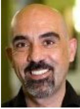
Gregorio Alonso García

Desde 2005 enseña historia y política de España y de América Latina en el Reino Unido, primero en King's College London, y desde 2009 en la Universidad de Leeds. Es autor de La nación en capilla. Ciudadanía católica y cuestión religiosa en España, 1793-1874 (Comares: Granada, 2014); y autor y coeditor de The Politics and the Memory of Democratic Transition: The Spanish Model (Nueva York: Routledge, 2011) y de Londres y el Liberalismo Hispánico (Madrid/Frankfurt am Main: Iberoamericana/Vervuert, 2011). También es autor y co-editor de The Soul of the nation (s), Catholicism and nationalization , que publicará Berghahn en 2024. Sus trabajos han aparecido en Contemporary Church History , Diacronie , Global Intellectual History , Hispania Nova , Historia Social , History of European Ideas , Journal of Iberian and Latin American Studies , y Pasado y Memoria . Es miembro fundador y co-director del Centre for the History of Ibero-America (University of Leeds); y de la Nineteenth Century Hispanists Network . Desde enero de 2016 es el editor del Journal of Iberian and Latin American Studies (Routledge). En la actualidad está completando una nueva monografía sobre las luchas imperiales y las dimensiones europeas la emancipación de Hispanoamérica