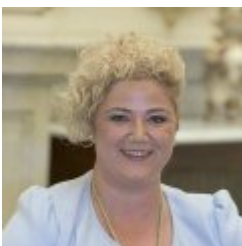
Maite Peña Lopez

Realizó sus estudios de Filosofía en la Universidad del País Vasco aunque su compromiso hacia la política ha estado muy enraizada desde su juventud. Su andadura en la política empezó a los 15 años de la mano de EGI Beasain y desde su adolescencia ha sentido la curiosidad y la necesidad de trabajar por la ciudadanía y por la construcción de un entorno vasco y cultural. Durante todos esos años ha desempeñado diferentes funciones dentro de EAJ-PNV. En las legislaturas 2007-2011 y 2015-2019 ha sido Diputado General de Gipuzkoa y desde las últimas elecciones de mayo, vuelve por tercera vez a la misma función, con el fin de trabajar a conciencia en los próximos cuatro años para conseguir una mejor Gipuzkoa.