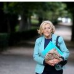
Manuela Carmena Castrillo