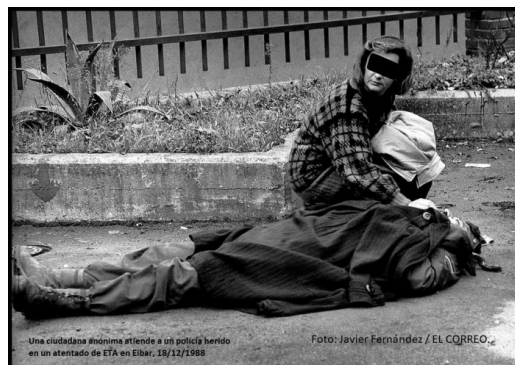
Una ciudadana anónima atiende a un policía herido en un atentado de ETA en Eibar, 18/12/1988