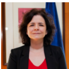
Milagros Paniagua San Martín

Actualmente, Milagros Paniagua es la Secretaria General de Objetivos y Políticas de Inclusión y Previsión Social, del Ministerio de Inclusión, Seguridad Social y Migraciones. Con anterioridad, fue la coordinadora del "Spending Review" en la AIREF (Autoridad Independiente de Responsabilidad Fiscal de España), donde participó, entre otros, en la evaluación de las Políticas Activas de Empleo y los Programas de Rentas Mínimas en España, pues Milagros es especialista en el análisis de datos y en la evaluación de políticas públicas. Ha ocupado puestos en el Instituto Nacional de Estadística (INE), donde se especializó en la producción y el análisis de datos, en concreto en la Encuesta de Condiciones de vida; y en el Instituto de Estudios Fiscales (IEF) donde colaboró con la D.G. Fondos Europeos (FEDER y FSE) y diversos organismos de América Latina y el Norte de África en la evaluación de las finanzas públicas. Sólo reseñar que la vocación de Milagros Paniagua por los datos se inicia desde su formación como licenciada en Ciencias Matemáticas y doctora en Economía. Milagros pertenece al Cuerpo Superior de Estadísticos del Estado.