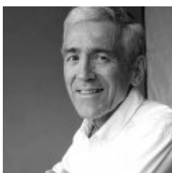
Francisco De Roux

Docente y exdirector de investigación del Centro Internacional para la Justicia Transicional (ICTJ) de 2001 a 2014. Ha sido asesor de diferentes órganos de Justicia Transicional en Perú, Guatemala, Marruecos, Filipinas y Colombia. Se desempeñó como primer Relator Especial sobre la promoción de la verdad, la justicia, la reparación y las garantías de no repetición de Naciones Unidas, hizo parte de la misión de Expertos Independientes para Burundi.