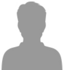
Iñigo Urkullu Renteria