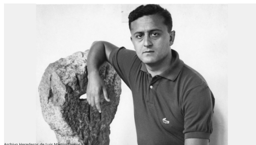
Archivo Herederos de Luis Martín-Santos