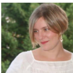
Sara Morante xxx

Fernando Marías (Bilbao, 1958) es novelista, editor e inventor de conceptos culturales. Autor de novelas como La luz prodigiosa, El Niño de los coroneles (Premio Nadal 2001), La mujer de las alas grises o Todo el amor y casi toda la muerte (Premio Primavera 2010). Su novela La isla del padre recibió el Premio Biblioteca Breve 2015. Entre sus novelas dirigidas al público juvenil destacan Cielo abajo (Premio Anaya 2005 y Premio Nacional de Literatura Infantil y Juvenil 2006), Zara y el librero de Bagdad (Premio Gran Angular 2008) y El silencio se mueve. De su obra, se ha llevado al cine La luz prodigiosa (adaptada por él mismo y dirigida por Miguel Hermoso, 2002, ganadora de numerosos premios internacionales) e Invasor (Daniel Calparsoro, 2012). En su faceta como editor destacan los proyectos HIJOS DE MARY SHELLEY y HNEGRA.