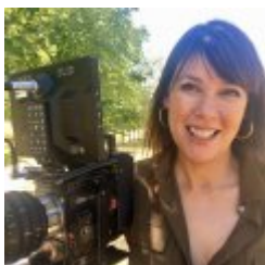
Mabel Lozano XXX

Guionista, productora y directora de cine social. 2017 Se encuentra en preproducción de "Paso corto, mala leche", un documental contado en primera persona por un proxeneta español, sobre el encubrimiento de la trata a través de los empresarios de los locales de alterne, donde se vende sexo de pago. Ha publicado también el libro "El proxeneta", para la editorial Al revés. En septiembre lanzó Chicas Nuevas 24 Horas: Happy, un videojuego para móviles que narra la travesía de una chica nigeriana desde su ciudad natal a España para ser explotada. Disponible para Apple y Android, con miles de descargas desde su lanzamiento. También escribe, produce y dirige la campaña #Yosñaba por encargo de la Fundación Once sobre violencia de género y discapacidad.