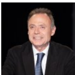
Vicente Garrido Genovés

General de Brigada de Infantería. DEM, Graduado por el Colegio de Defensa de la OTAN (Roma, Italia), Diplomado en Altos Estudios Internacionales por la Sociedad de Estudios Internacionales (Madrid, España), Diplomado de Estado Mayor, Especialista en Inteligencia del Eurocuerpo (Estrasburgo, Francia), Alta Gestión en Recursos Humanos por el Centro de Estudios Superiores de la Defensa, Misiones en: Bosnia Herzegovina, UNPROFOR (1.994/95), Irak (2003/04) y Libano UNIFIL (2013/14).