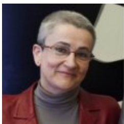
Marta Macho Stadler

- Profesor Titular de Geometría (UPV/EHU). Su investigación se centra en la Geometría Simpléctica y en la Cultura Matemática. - Director del portal DivulgaMAT, Centro Virtual de Divulgación de las Matemáticas ( www.divulgamat.net ). - Guionista y presentador del espacio "Una de Mates" del programa de TV (emitido en La 2), Órbita Laika (2014, 2015). Colaborador habitual del Programa Graffiti en Radio Euskadi (2005-2013) y La mecánica del caracol (2013-). Colaborador de la Cátedra de Cultura Científica. - Autor de los libros "La cuarta dimensión" y "El sueño del mapa perfecto" de la colección "El mundo es matemático" (2010) de la editorial RBA (publicados en Portugal, Italia, Francia, Inglaterra, Polonia, Grecia,...), y "Del ajedrez a los grafos" (2015). Autor del libro "Arthur Cayley" (2017), de la colección Genios de las Matemáticas, RBA. - V Premio José María Savirón de Divulgación Científica (modalidad nacional), en 2010. Premio COSCE a la Difusión de la Ciencia 2011.