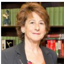
Adela Asua Batarrita

Catedrática de derecho penal UPV/EHU hasta su jubilación en 2018. Magistrada del Tribunal Constitucional (2011-2017). Vicepresidenta del TC 2013-2017. Publicaciones sobre varias líneas de derecho penal y política criminal; en cuanto a la temática de Delitos contra la libertad sexual y violencia de género destacan: "Violación: condenas a examen" 1995 "Las Agresiones sexuales en el nuevo código penal: regulación jurídica e imágenes culturales" 1998 "Los nuevos delitos de "violencia doméstica" 2004 "Las recientes medidas de prevención de la violencia de género en el ámbito de la pareja en la legislación española." 2005 "El significado de la violencia sexual contra las mujeres y la re-formulación de la tutela penal en este ámbito. Inercias jurisprudenciales" 2008 "La