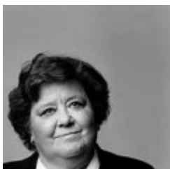
Cristina Almeida Castro

Licenciada en Derecho por la UCM. Abogada en ejercicio, abrió su primer despacho profesional en 1967, dedicándose a la defensa de trabajadores y presos políticos del franquismo. Diputada al Congreso de los Diputados en 1989 y 1996 por IU. Dedicada especialmente a la defensa y promoción de los derechos y la igualdad de la mujer, desde 1.968, dada las discriminaciones legales existentes contra las mujeres. Ha participado en gran número de iniciativas nacionales e internacionales en este terreno, como la Conferencia Mundial organizada por las Naciones Unidas en Nairobi, en el año 1985 y en Pekín, en 1995. Fue Vocal independiente del Instituto de la Mujer en el momento de su creación. Ha escrito diversos libros colectivos sobre feminismo y 3 más individuales "Carta abierta a una política honesta sobre la corrupción", "En defensa de la mujer" y "Las Huellas de la violencia invisible".