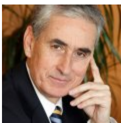
Ramón Jáuregi Atondo

Ramón Jáuregui Atondo ha ejercido variadas e importantes responsabilidades en el campo de la política regional, estatal y europea. A nivel regional, ha sido Vicelehendakari del Gobierno Vasco, así como Consejero de Justicia, Economía, Trabajo y Seguridad Social. En el ámbito estatal, fue Diputado en el Congreso de los Diputados, así como Ministro de Presidencia del Gobierno de España. En lo referente al campo de la política europea, ha sido miembro del Parlamento Europeo en dos ocasiones (de 2009 a 2010 y de 2014 a 2019). Es Ingeniero Técnico por la Escuela de Peritos de San Sebastián y Licenciado en Derecho por la Universidad del País Vasco. Ha ejercido como abogado en materia de Derecho laboral. Es autor de varios libros y numerosos artículos sobre el Estado autonómico, nacionalismo, las relaciones laborales y justicia social, entre otros.