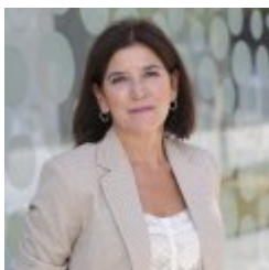
Izaskun Bilbao Barandika

Desde 2009-: Diputada al Parlamento Europeo Licenciada en Derecho (UPV) Máster en Gestión de Empresas - UPV Carrera política 1987-1991: Concejala del Ayuntamiento de Bermeo, áreas de Urbanismo y Cultura 1998-2001: VI Legislatura - Presidenta de la Comisión de Agricultura y Pesca; vocal de la Comisión de Instituciones e Interior, de la Comisión de Economía y Presupuestos y de la Comisión de Mujer y Juventud. 2001-2005: VII Legislatura - Parlamentaria en el Parlamento Vasco; presidenta de la Comisión de Agricultura y Pesca; vocal de la Comisión de Instituciones e Interior, de la Comisión de Industria, Comercio y Turismo, de la Comisión de Mujer y Juventud y de la Comisión de Control de Gastos Reservados. 2005-2009: VIII Legislatura - Presidenta del Parlamento Vasco. 04/2009-07/2009: Parlamentaria en el Parlamento Vasco. 1989-1994: Directora de Servicios del Departamento de Cultura del Gobierno Vasco. 1996-1998: Direcde Servicios del Departamento de Interior de