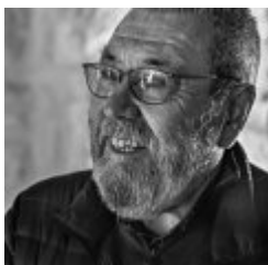
Cándido Méndez Rodríguez

Secretario General de la Unión General de Trabajadores de España de 1994 a 2016, y Presidente de la Confederación Europea de Sindicatos, ETUC-CES de 2003 a 2007. Acabo de publicar un libro titulado POR UNA NUEVA CONCIENCIA SOCIAL. Casado, con dos hijos y tres nietas y un nieto. Ingeniero Técnico Químico. Jubilado