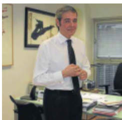
Andoni Iturbe Amorebieta

Gobierno Vasco / Eusko Jaurlaritza - Viceconsejero de Cultura