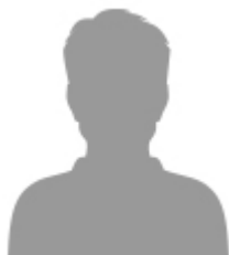
Andoni Ortuzar Arruabarrena

Ramón Jáuregui Atondo ha ejercido variadas e importantes responsabilidades en el campo de la política regional, estatal y europea. A nivel regional, ha sido Vicelehendakari del Gobierno Vasco, así como Consejero de Justicia, Economía, Trabajo y Seguridad Social. En el ámbito estatal, fue Diputado en el Congreso de los Diputados, así como Ministro de Presidencia del Gobierno de España. En lo referente al campo de la política europea, ha sido miembro del Parlamento Europeo en dos ocasiones (de 2009 a 2010 y de 2014 a 2019). Es Ingeniero Técnico por la Escuela de Peritos de San Sebastián y Licenciado en Derecho por la Universidad del País Vasco. Ha ejercido como abogado en materia de Derecho laboral. Es autor de varios libros y numerosos artículos sobre el Estado autonómico, nacionalismo, las relaciones laborales y justicia social, entre otros.