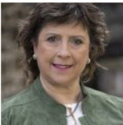
Koldobike Olabide Huelga

Legazpiko Udala, Legazpiko Alkatea / Alcaldesa de Legazpi