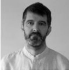
Mikel Landa Esparza