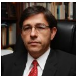
Manuel José Cepeda Espinosa

Pompeu Fabra Unibertsitateko Konstituzio Zuzenbideko katedraduna. Diploma d' Études Approfondies del Institut d' Études Politiques de Paris (Fondation National des Sciences Politiques). Hainbat unibertsitatetako irakasle bisitaria. Pompeu Fabra Unibertsitateko Zuzenbide Publikoko Doktoretza Ikastaroko zuzendaria izan da (1992-2008). Egungo ikerketa-ildoak honako hauek dira: eskubideen eta askatasunen araubide juridikoa; Europako zuzenbidea eta Estatuaren eta autonomia-erkidegoen artean eskumenak banatzeko sistema. Hainbat monografia eta Konstituzio Zuzenbideko artikulua idatzi ditu. Honako hauetako kontseilaria izan da: Kataluniako Berme Estatu-bermeen Kontseilua (2009- 2019); Kataluniako Generalitatearen Aholkularitza Kontseilua (2005-2009); Kataluniako Generalitatearen Aholku Batzorde Juridikoko kidea (1991-2005); Espainiako Hauteskunde Batzorde Zentraleko kidea (1994-1997) eta Kataluniako Informazio Kontseiluko kidea (sortu zenetik 2009ra arte).