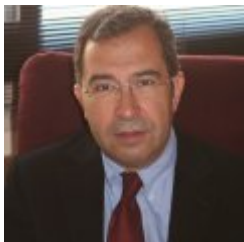
Marc Carrillo López

Pompeu Fabra Unibertsitateko Konstituzio Zuzenbideko katedraduna. Diploma d' Études Approfondies del Institut d' Études Politiques de Paris (Fondation National des Sciences Politiques). Hainbat unibertsitatetako irakasle bisitaria. Pompeu Fabra Unibertsitateko Zuzenbide Publikoko Doktoretza Ikastaroko zuzendaria izan da (1992-2008). Egungo ikerketa-ildoak honako hauek dira: eskubideen eta askatasunen araubide juridikoa; Europako zuzenbidea eta Estatuaren eta autonomia-erkidegoen artean eskumenak banatzeko sistema. Hainbat monografia eta Konstituzio Zuzenbideko artikulua idatzi ditu. Honako hauetako kontseilaria izan da: Kataluniako Berme Estatu-bermeen Kontseilua (2009- 2019); Kataluniako Generalitatearen Aholkularitza Kontseilua (2005-2009); Kataluniako Generalitatearen Aholku Batzorde Juridikoko kidea (1991-2005); Espainiako Hauteskunde Batzorde Zentraleko kidea (1994-1997) eta Kataluniako Informazio Kontseiluko kidea (sortu zenetik 2009ra arte).