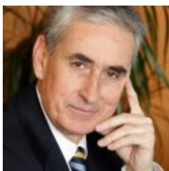
Ramón Jáuregi Atondo

Ramón Jáuregi Atondo ha ejercido variadas e importantes responsabilidades en el campo de la política regional, estatal y europea. A nivel regional, ha sido Vicelehendakari del Gobierno Vasco, así como Consejero de Justicia, Economía, Trabajo y Seguridad Social. En el ámbito estatal, fue Diputado en el Congreso de los Diputados, así como Ministro de Presidencia del Gobierno de España. En lo referente al campo de la política europea, ha sido miembro del Parlamento Europeo en dos ocasiones (de 2009 a 2010 y de 2014 a 2019). Es Ingeniero Técnico por la Escuela de Peritos de San Sebastián y Licenciado en Derecho por la Universidad del País Vasco. Ha ejercido como abogado en materia de Derecho laboral. Es autor de varios libros y numerosos artículos sobre el Estado autonómico, nacionalismo, las relaciones laborales y justicia social, entre otros.