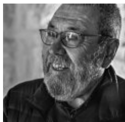
Cándido Méndez Rodríguez

Secretario General de la Unión General de Trabajadores de España de 1994 a 2016, y Presidente de la Confederación Europea de Sindicatos, ETUC-CES de 2003 a 2007. Acabo de publicar un libro titulado POR UNA NUEVA CONCIENCIA SOCIAL. Casado, con dos hijos y tres nietas y un nieto. Ingeniero Técnico Químico. Jubilado