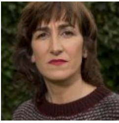
Iorea agirre agirre